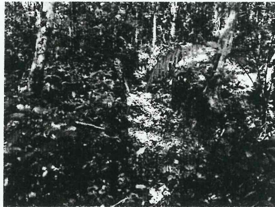
Foto 6. Montículo en sitio arqueológico Ixqueej