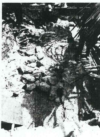
Foto 9. Trabajos de intervención, Edificio 137