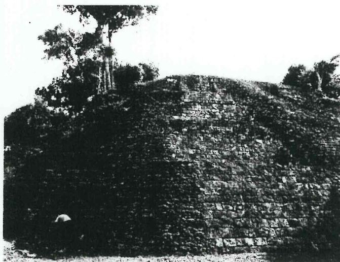
Foto 2. Edificio 144, Acrópolis Norte durante los trabajos