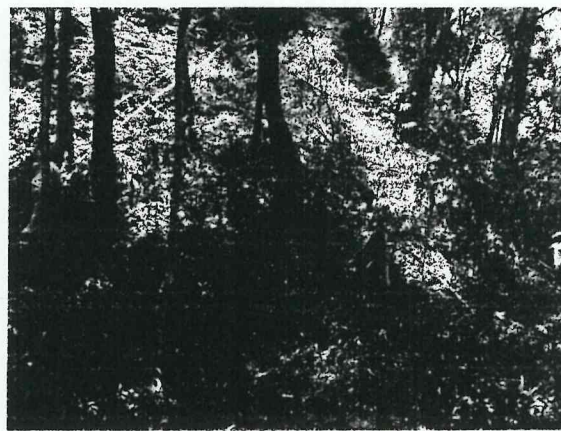
Foto 7. Montículo, sitio arqueológico Naranjito