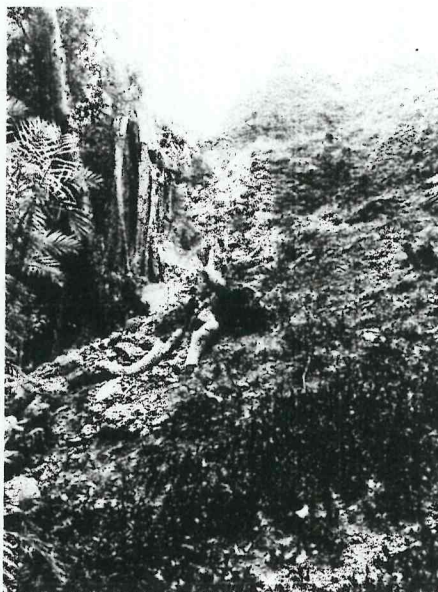
Foto 8. Derrumbe en Edificio C, Nakum