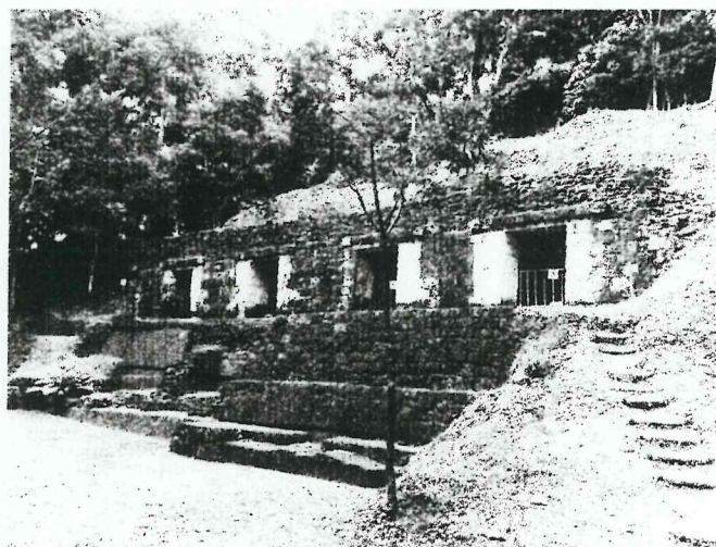
Foto 3. Edificio 389, Acrópolis Sur