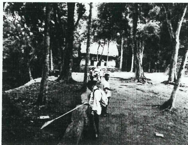
Foto 5. Topoxte, Plaza Principal