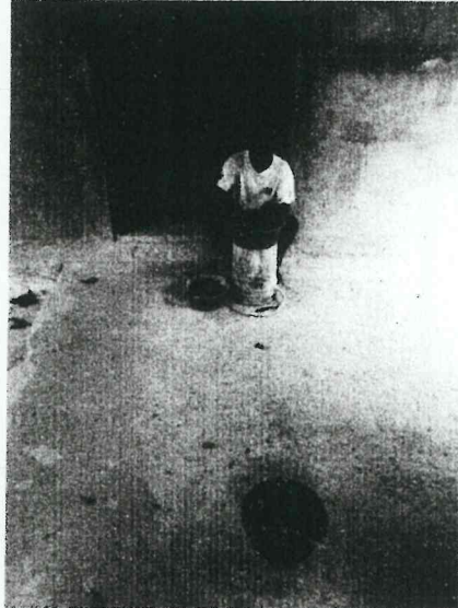
Foto 10. Cerámica producto de los trabajos en el Edificio 137 en proceso de lavado

10. Los materiales culturales, especialmente cerámica que ha sido recuperada durante los trabajos en el Edificio 137 ha sido llevada al laboratorio de materiales arqueológicos del parque, la cual está pasando por un proceso inicial de selección, lavado y marcado para pasar seguidamente al proceso de análisis, lo que permitirá obtener información cronológica vital para conocer y comprender la historia, evolución y desarrollo de dicho edificio.